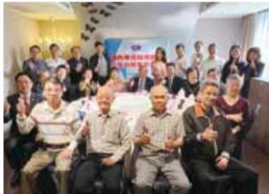
參與僑團座談者合影。

03/22華僑救國聯合總會舉辦國內華僑及歸僑團體暨在台校友會座談餐會，邀請僑務委員會徐佳青委員長、僑民處閻樹榮副處長、李嘉宜科長、僑生處張文華專門委員參加，與各歸僑團體及在台校友會進行交流。（僑訊1465 A1期）