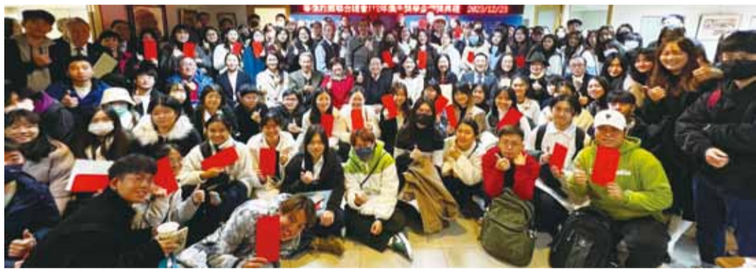
得獎同學與貴賓合影。