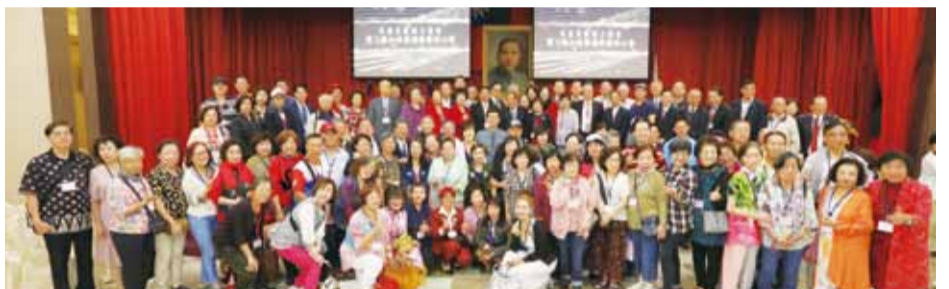
華僑節大會與會貴賓合影。

10/12由華僑救國聯合總會主辦的第71屆華僑節慶祝大會上午9時在台北市國軍英雄館舉行，海內外華僑、歸僑個人、團體及全國各界代表600人與會共襄盛舉，場面盛大熱鬧溫馨，充分顯示僑胞對中華民國的凝聚向心力。馬英九前總統、僑委會阮昭雄副委員長、中國國民黨朱立倫主席、立法院溫玉霞委員及前立委童惠珍等多位應邀參加並致詞。（僑訊1472期A1）