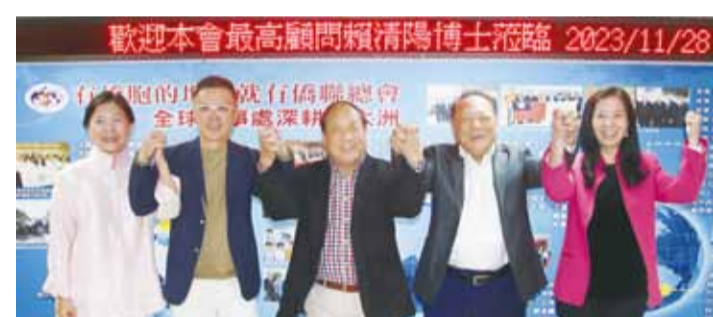
歡迎本會最高顧問賴清陽博士蒞臨 2023/11/28