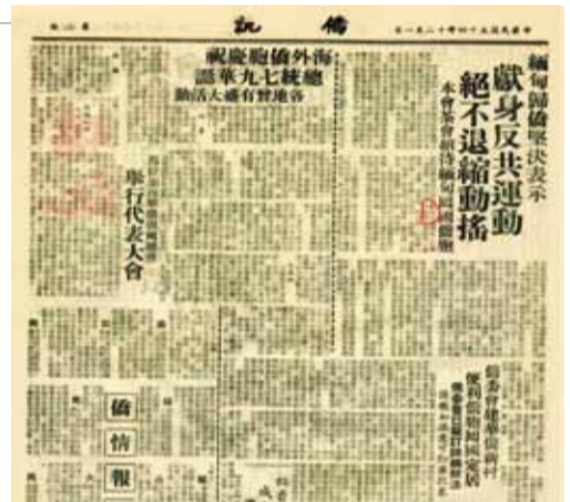
民國54年12月1日310期的「僑訊」。