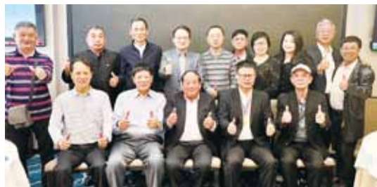
鄭理事長與澳門僑聯同仁合影。