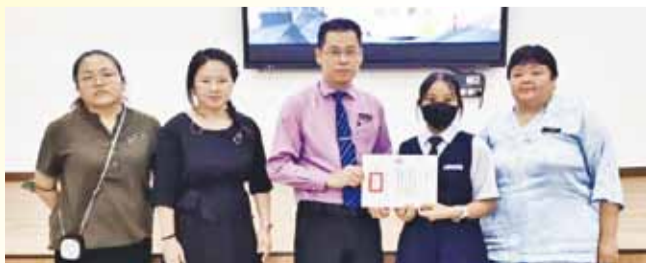
馬來西亞美裡社當中華公學亞麗同學（右二）參加海外華校小學組書法比賽獲獎，在該校接受頒獎。