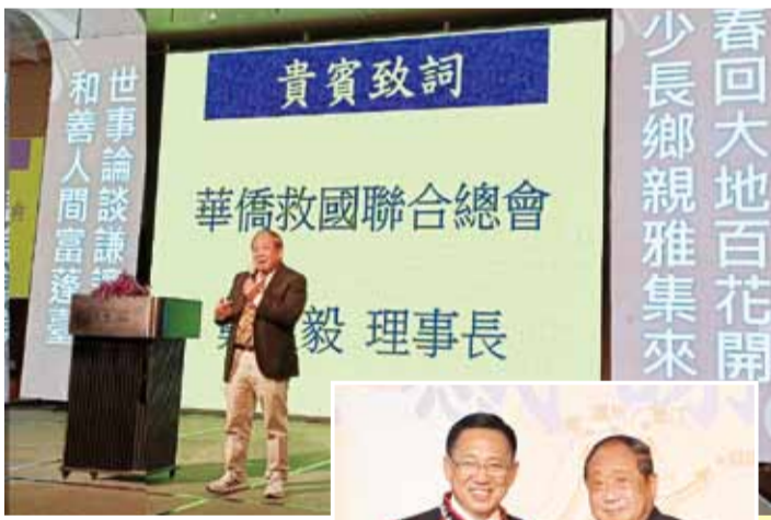
鄭理事長參加緬甸留台同學總會年會時致詞。