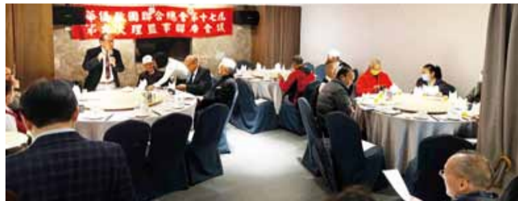
鄭理事長向理監事們做會務報告。