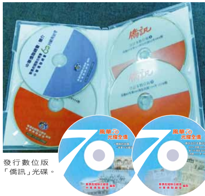
發行數位版「僑訊」光碟。

• 09/30「風華 70 光耀全僑」專集有 2 片光碟，包括 1 片僑聯簡介和僑聯「風華 70 光耀全僑」紀念專書及 1 片僑聯會刊自 2016 年 1 月至 2022 年 8 月，共 80 期的「僑訊」電子版。