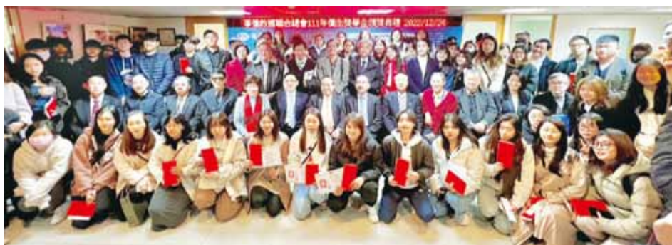
得獎同學與貴賓合影。

僑光社／台北 由僑聯文教基金會辦理之 111 年各種僑生獎學金，12 月 24 日上午舉行頒獎典禮，253 位品學兼優僑生獲得殊榮。