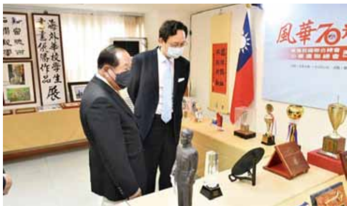
童振源委員長參觀華僑救國聯合總會「風華 70 光耀全僑」歷史文物圖片展。

一張張老照片，數十座獎盃、各式卷軸和手寫書法陳列在展覽室，紀載著僑聯總會的珍貴回憶，僑委會委員長童振源受邀擔任開幕典禮致詞嘉賓，包括立法委員李德維、駐捷克辦事處前大使汪忠一，以及駐瓜地馬拉大使館前大使孫大成都是座上賓，海外僑胞共計 200 人共襄盛舉，開幕典禮熱鬧溫馨。（僑訊 1459 期）