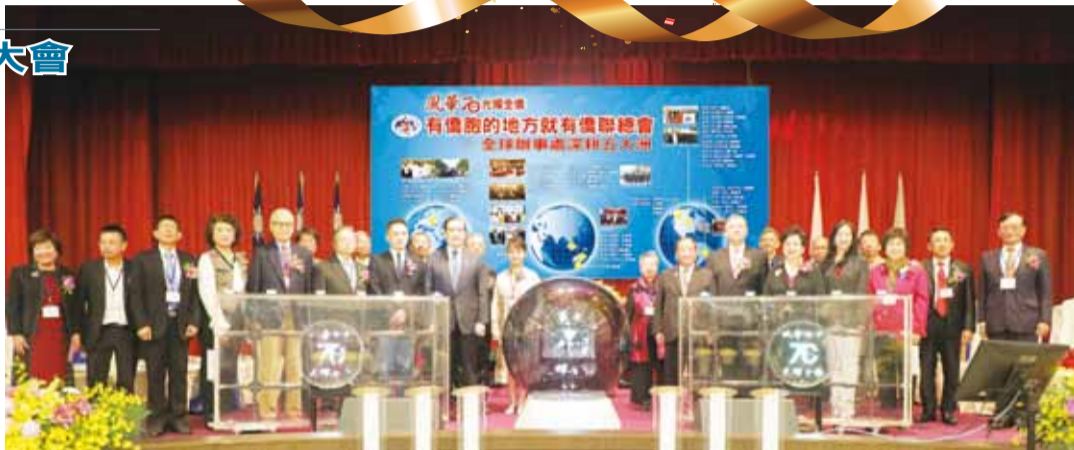
貴賓們為開幕典禮進行點燈儀式。

• 10/12 由華僑救國聯合總會主辦的第 70 屆華僑節慶祝大會暨第 17 屆第 3 次海外理事會，上午 9 時在台北市國軍英雄館舉行，海內外華僑、歸僑個人、團體及全國各界代表 600 人與會共襄盛舉，場面盛大熱鬧溫馨，充分顯示僑胞對中華民國的凝聚向心力。（僑訊 1460 期）