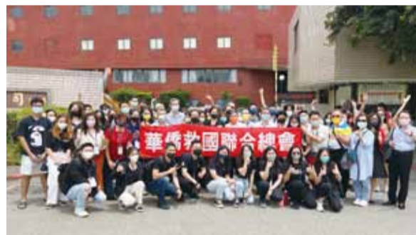
全體同學參訪企業後合影。

• 06/17 畢業季到來，廣大在台就讀的僑生即將進入求職市場。華僑救國聯合總會視僑如親，率印尼、緬甸、越南、馬來西亞等地區僑生，前往宏泰電工、世紀風電兩家上市公司參訪，藉由第一線的觀察體會，了解自己