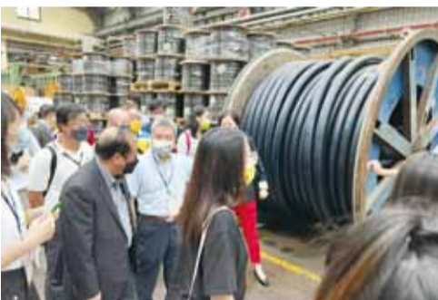
鄭理事長親自帶領同學參觀宏泰電工第一線作業情形。