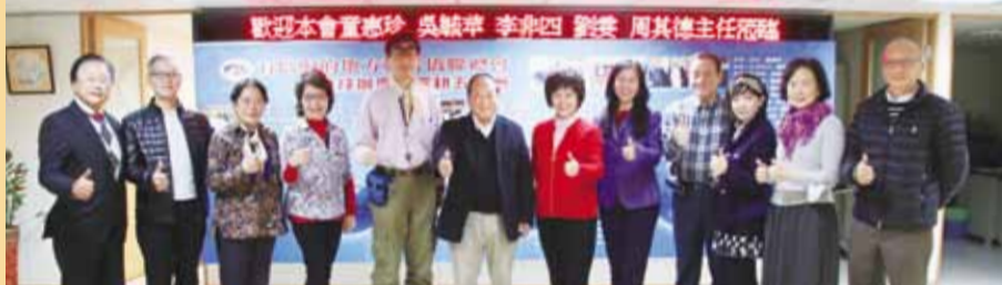
▶鄭理事長(右七)與海外辦事處主任等合影。

權益外，更要敞開大門，廣納各方俊彥，形成凝聚僑心、繁榮僑社、傳承文化的主力。僑聯，是個面向海外、面向全球的組織，今後凡是與