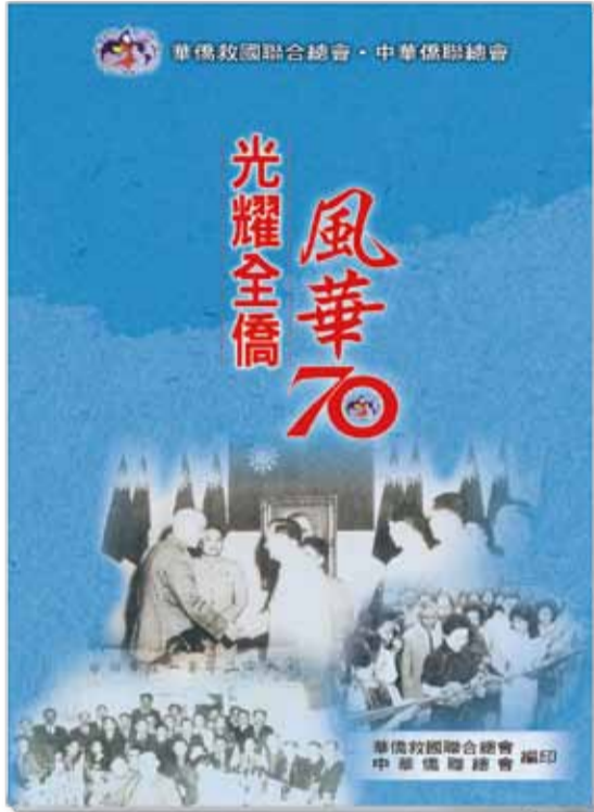
「風華 70 光耀全僑」紀念專書。

• 08/31 慶祝僑聯創會 70 周年，編製的「風華 70 光耀全僑」紀念專書，專書以菊 8 開、全彩、雪銅紙印製，內容除登錄各界賀電外，也概述了僑聯的成長故事，更有來自海內外對僑聯祝福、期許的文稿，值得珍藏。（僑訊 1458 期）