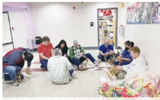
梅山臺灣華語文學習中心學生一同組裝九節龍。

當天一早，校長孫曉慧已在入口設置好報到處，井然有序的發放每位參加者臺式風味餐盒及飲水，家長們大手牽小手，一家大小歡喜來