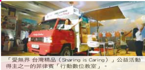
「愛無界 台灣精品 (Sharing is Caring)」公益活動得主之一的菲律賓「行動數位教室」。

台灣行動數位教室為菲律賓偏鄉教育盡心力 協助弱勢族群持續受教 增進技能與改善生活