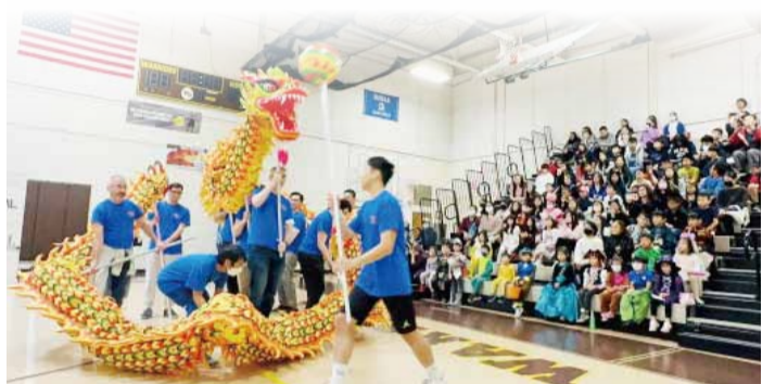
梅山臺灣華語文學習中心學生們表演精采的舞龍。