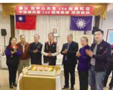
國民黨駐美京分部向國父致敬。