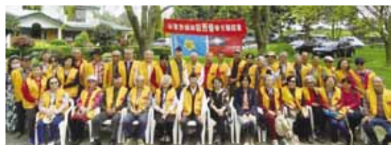
紐西蘭榮光聯誼會全體參與人員合影留念。

行販售，其中最特別的莫過於珍珠奶茶環保提袋，可愛的圖樣以及創意又具環保意識的設計讓商品幾乎銷售一空，此外，同鄉會多位鄉親的巧手之下，手工原味呈現傳統夜市遊戲套圈圈以及打彈