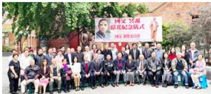
墨爾本僑界向國父致敬。

澳洲墨爾本／墨爾本國父銅像委員會11月19日上午，在墨市華埠國父銅像前，隆重舉辦紀念儀式。