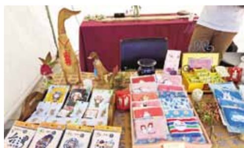
同鄉會從臺灣空運來南澳販售的小物。

行販售，其中最特別的莫過於珍珠奶茶環保提袋，可愛的圖樣以及創意又具環保意識的設計讓商品幾乎銷售一空，此外，同鄉會多位鄉親的巧手之下，手工原味呈現傳統夜市遊戲套圈圈以及打彈