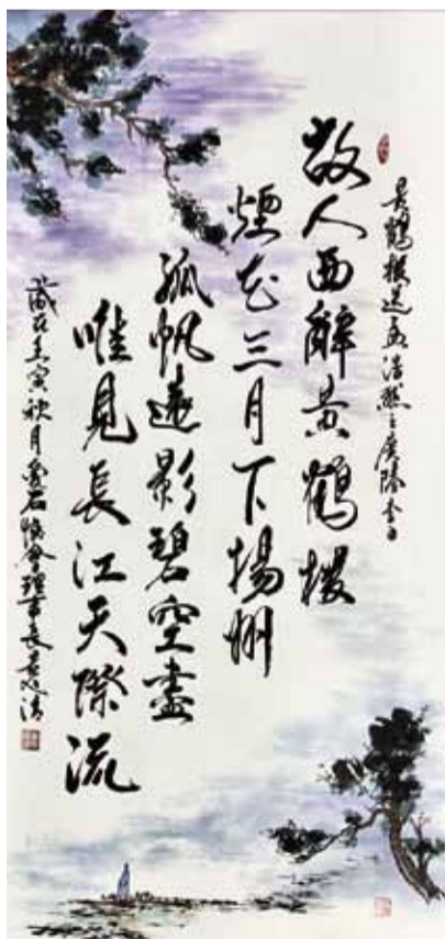
黃旭清 李白詩 故人西辭黃鶴樓，煙花三月下揚州。 孤帆遠影碧空盡，唯見長江天際流。