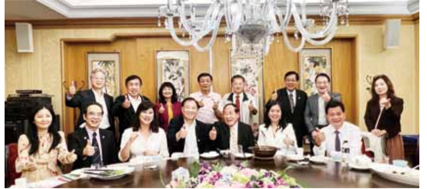
鄭理事長（前排右三）與救國團葛永光主任（前排中）及一級主管合影。

此外，鄭理事長也十分感謝救國團協助本會舉辦海外僑胞雲嘉南三日遊活動，讓僑胞回到台灣貼近風土人情與中華文化，個個滿載而歸。