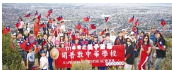
南非開普敦中華學校親子登山健行慶雙十。