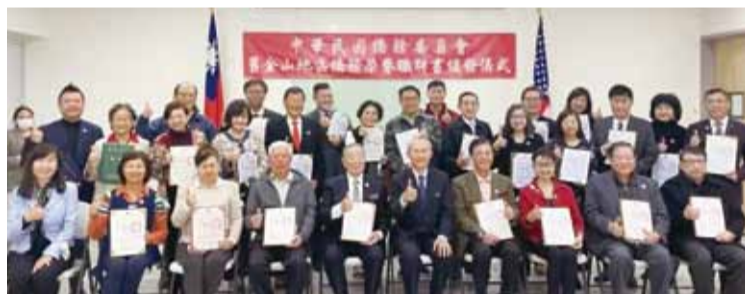
獲頒僑務榮譽職聘書者合影。