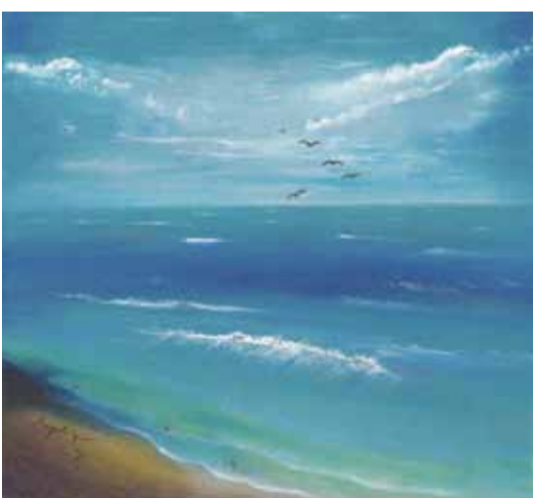
游翠英 海天一色 (油畫)