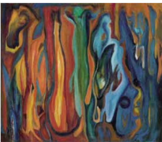
謝恆和 舞動內在的叢林 (油畫)