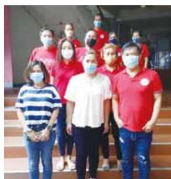
菲律賓新任副總統莎拉·杜特地（前排中）與晨光中學教職員合影，前排右一是黃思華校長。

學生們從 Taiwan Plus 影片認識傳統大鼓的製作過程，再從全球華文網 110 年度民俗文化影片了解臺灣獅的特色與動作，兩人一組練習舞獅動作，感到新奇有趣。