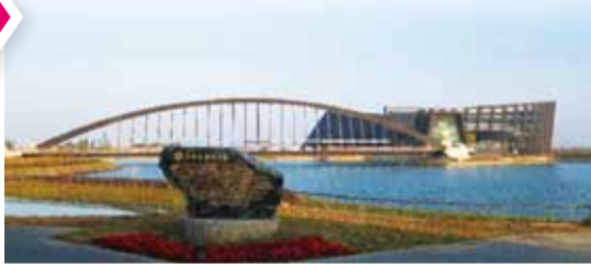
總面積約 70 公頃的故宮南院，以傳統水墨畫之「濃墨」、「飛白」及「渲染」三種筆法為概念發想，發展出虛、實量體相互交織的流線形體。 （轉載自故宮南院網站）

感謝僑聯總會 讓我們在台灣不孤單 身體力行親睹歷史文化 品嚐在地美食 結識不同國家的朋友