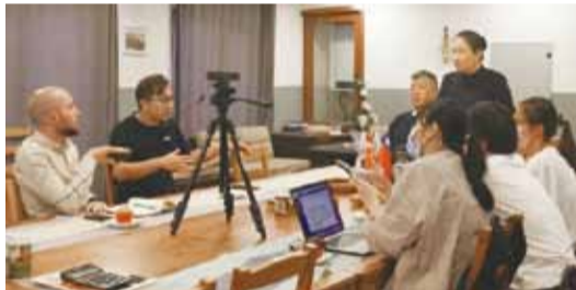
「癒合無聲傷痕—親密關係衝突討論」大家討論踴躍。

土耳其／異國婚姻的維持不易，大至宗教、風俗小至家庭經濟、教養，常造成溝通不良甚至衝突發生；但因語言及對土耳其政府單位的不熟悉，求助無門，有鑑於此，土耳其臺灣同鄉會會特別邀請土耳其慈濟基金會