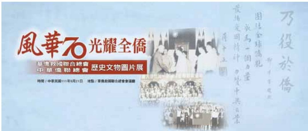
僑聯歷史文物圖片展。

無法回國參與盛會的部份海外辦事處主任、常務理事，除循例提供書面僑情報告，裨供印製議事手冊之外，同時並以手機自拍一段