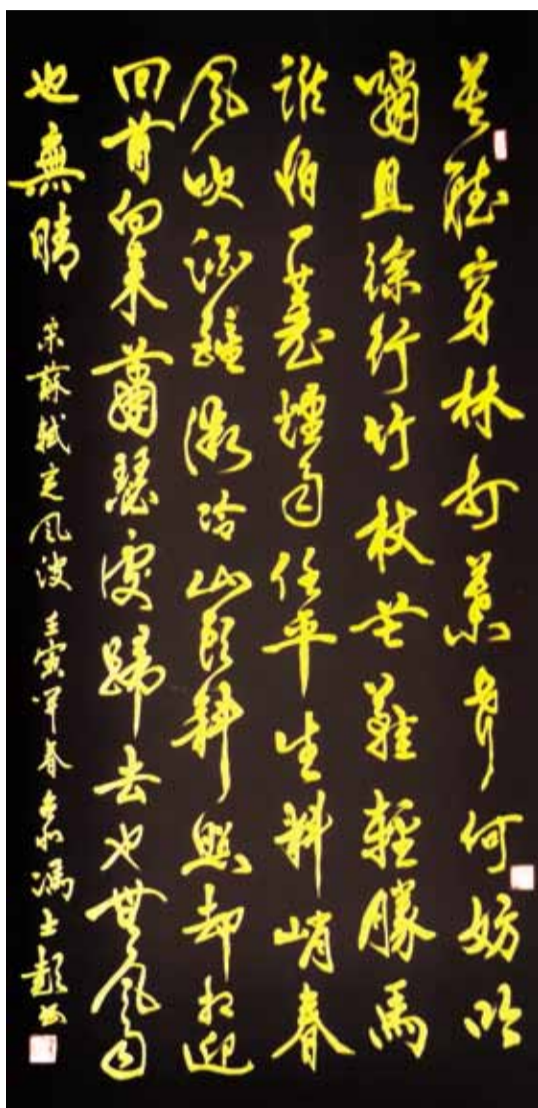
馮士彭 宋 蘇軾 定風波 莫聽穿林打葉聲， 何妨吟嘯且徐行。 竹杖芒鞋輕勝馬， 誰怕！一蓑煙雨任平生。 料峭春風吹酒醒， 微冷，山頭斜照卻相迎。 回首向來蕭瑟處， 歸去，也無風雨也無晴！