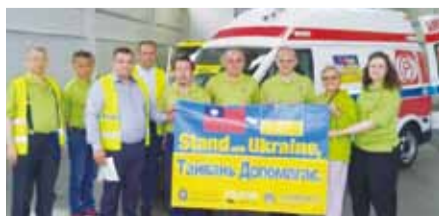
世台聯合基金會捐贈烏克蘭醫院救護車。