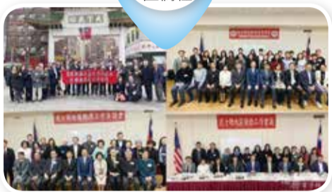
美國波士頓地區僑社