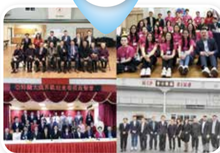
美國亞特蘭大地區僑社