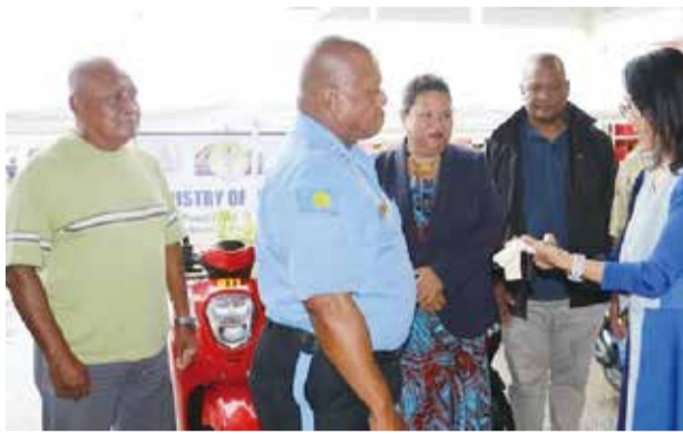
臺灣捐贈帛琉巡邏用公務摩托車交接典禮。