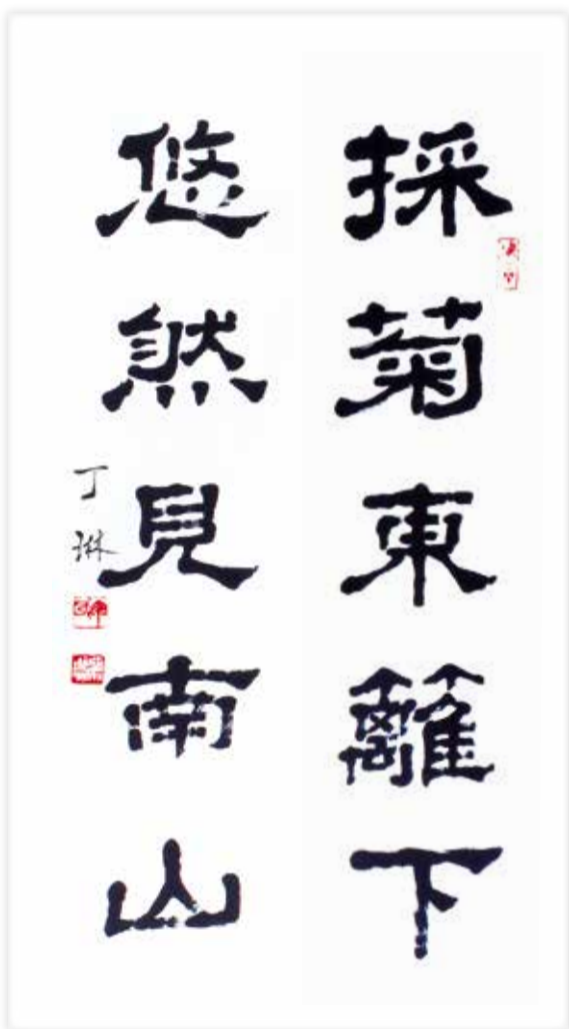
丁琳 對聯 採菊東籬下(右) 悠然見南山(左)

元初四年，常山相隴西馮君到官，承飢衰之後，恭惟三公御語山，三條別神，迴在領西。吏民禱祀，興雲膚寸，偏雨四維。遭離羌寇，蝗旱高並，民流道荒。醮祠希罕，口莫不行。由是之來，和氣不臻，乃求道要，本祖其原。以三公惠廣，其神尤靈。處幽道艱，存之者難。卜擇吉口治東，就衡山起堂立壇，雙闕夾門。薦牲納禮，以寧其神。神熹其位，甘雨屢降。報如景響，國界大豐。谷升三錢，民無疾苦，永保其年。長史魯國顏口、五官掾閻祐、戶曹史紀受、將作掾王箒、元氏令茅厓、丞吳音、遷掾郭洪、戶曹史翟福、工宋高等刊石紀焉。