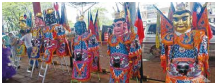
電音三太子插有中華民國國旗、展現臺灣民俗文化。

巴拉圭「好客東道主」活動起自2015年，除了東方市外，觀光部亦在恩卡納西翁(Encarnación)、貝多芳(Pedro Juan Caballero)、法爾孔港(Puerto Falcón)等邊境城市發起，透過巴國的傳統舞蹈、音樂、商業促銷方案等內容吸引外國觀光客前來巴國旅遊購物。