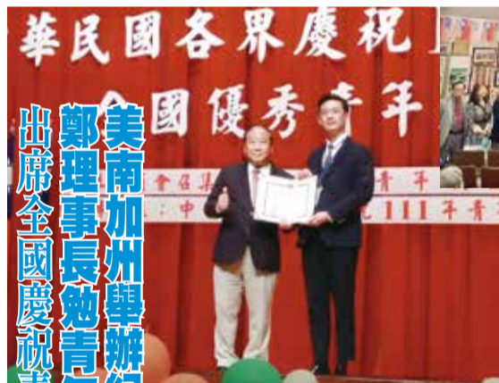
鄭理事長(左)參加青年節活動。

美南加州舉辦紀念黃花崗72烈士建國展 鄭理事長勉勵青年獎章得獎人立楷模典範 出席全國慶祝青年節活動