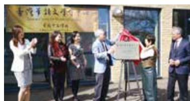
英國第2所臺灣華語文學習中心在肯特的華園中文學校揭牌。

本次善心臺商所捐贈的南非荊桐樹，相信在召喚中學悉心澆灌下，「十年樹木百年樹人」，荒地上的幼樹終將長出堅實枝幹，布滿綠葉，開滿鮮豔紅花，茁壯成厚實大樹，得著豐盛生命。