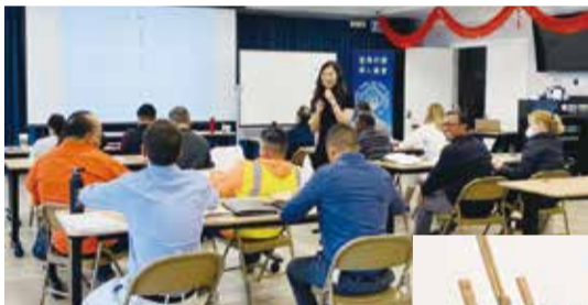
聖瑪利諾中文學校「市府基層員工專班」上課情形。

本次捐贈的愛心物資包括輪椅、便器椅、腋下拐及四腳拐等助行器，將在捐贈儀式結束後，透過身障事務部和非政府組織協助分送給當地身障民眾。