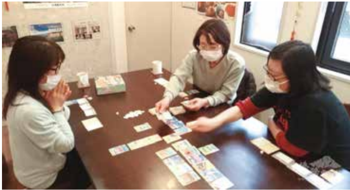
盛岡華語教室的學生們運用桌遊學華語。

日本盛岡／盛岡華語教室最近收到了僑務委員會寄來的「腳踏車旅遊—臺灣YouBike騎遇記桌上遊戲（THE BIKE TOURS TAIWAN）」與「四季之森 桌上遊戲國際版（HARVEST ISLAND A FRUIT GLOWER）」兩套桌上遊