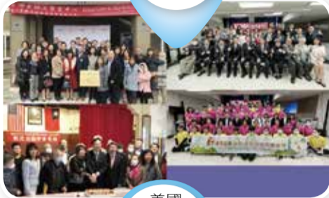
美國波士頓地區僑社