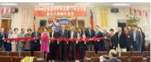
美國南加州參加慶祝青年節及歷史文物圖片展者合影。

美國洛杉磯／南加州全僑慶祝中國民國111年青年節歷史文物圖片展覽開幕典禮，3月22日上午在羅省中華會館舉行。