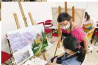
聖保羅文教中心才藝班油畫老師指導學生畫畫。