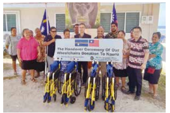
臺灣捐贈諾魯一批愛心輪椅及行走輔具。