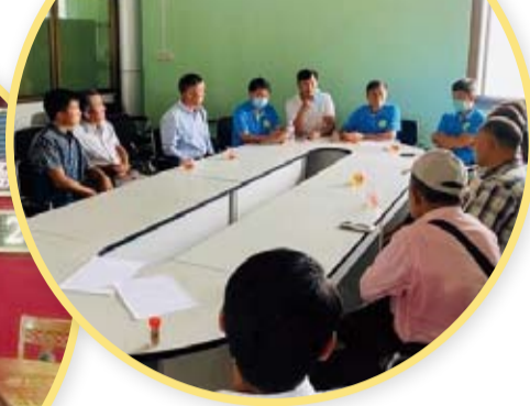
愛緬基金會協助執行香港龍門勵學基金會援助緬甸暨啟動十年完夢計畫。(轉載自宏觀電子報)