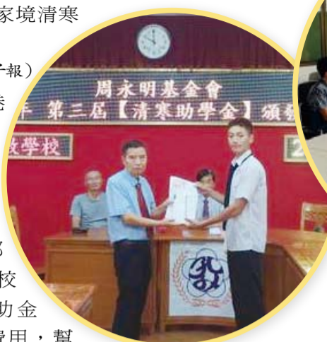
即將赴臺就學的畢業生接受獎助學金。