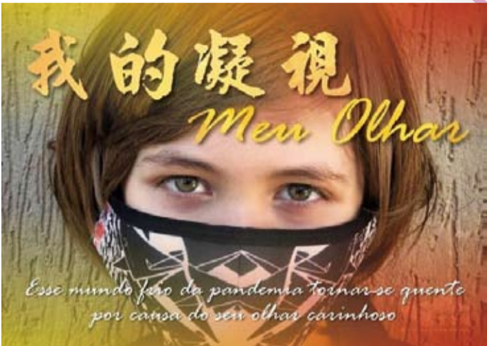
宣傳短片「我的凝視Meu Olhar」冰冷的疫情世界，因為你的關懷凝視而溫暖。(轉載自宏觀電子報)

聖保羅／巴西新冠狀病毒(COVID-19)疫情持續嚴峻，每個人都戴上口罩來防疫，只留下眼睛，一位聖保羅藝術愛好者，拍攝各種不同眼神的照片，在地下鐵站放上醫護戴面罩的圖片，照片中醫護們透過眼睛傳達關愛鼓勵的眼神，撫慰生活在恐慌疫情的人民。這個情景引起了巴西華僑緊急援助志工小組與巴西關愛團體的注意，她們共同發起一個以