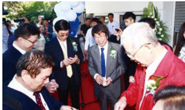
HCG Showroom 2013年12月開幕，時任監察院長的王建煊（右）光臨剪綵，右二是冷耀東主任。