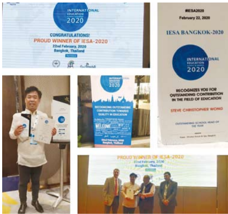
晨光中學黃思華校長獲頒國際「年度傑出校長獎」。

菲律賓／晨光中學黃思華校長於1月11日下午二時於甲美地市BAYLEAF HOTEL接受亞太教育培訓學會頒發第一屆APAETI卓越教師獎之傑出校長獎。