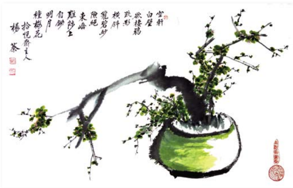
楊葵 瓶梅 空軒白壁欲棲鴉，疏影橫斜籠碧紗，險絕東嶠難陟上，自鋤明月種梅花。