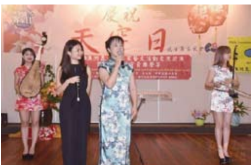
紅如樂團演出精彩樂音。