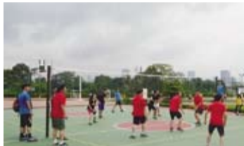
印尼留臺校友會青年部第3屆運動會參賽踴躍。

各地留臺校友學長姐與學弟妹約150餘人參與運動會，參賽選手揮灑汗水同場競技，場面熱絡。