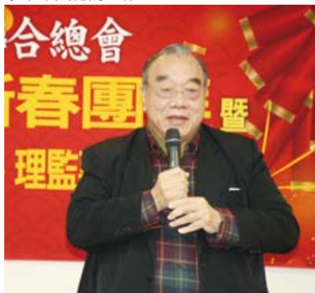
本會簡漢生名譽理事長期勉僑聯百尺竿頭更上層樓。