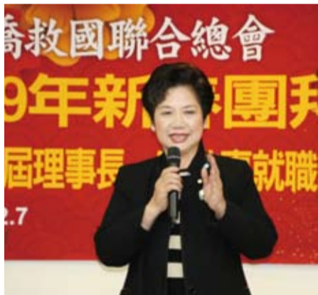
立法院溫玉霞委員強調，樂意配合僑聯傳承中華文化的工作。