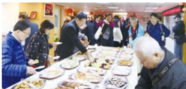
本會新春團拜準備精緻茶點，提供貴賓會後交流聯誼。