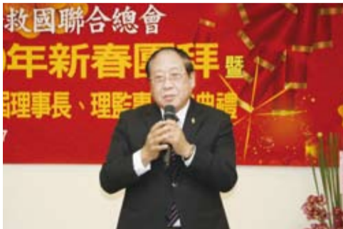
鄭理事長承諾一步一腳印做好服務僑胞的工作。

事長等近兩百位貴賓蒞臨參加，盛況空前。當選本會第十七屆的常務理事、理事、常務監事、監事，也正式就職並與大家見面。典禮開始，大家拱手互道恭喜，祝福彼此順心平安，鼠年數錢數不完。