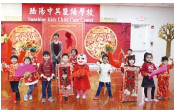
驕陽中英雙語學校小朋友穿著應景服裝，唱唱跳跳喜氣洋洋。

舊金山／歡聲笑語辭舊歲，載歌載舞迎新年。2020年1月31日，位於佛利蒙的驕陽中英雙語學校的迎新春晚會在孩子們的期盼中如約而至。但這是一場沒有觀眾的特殊晚會。