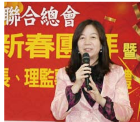
前立委童惠珍期待僑聯能繼續凝聚僑心。