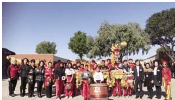
Mayfair中學師生以舞龍表演迎接洛杉磯文教中心與文化志工來訪。

化，隨著時代的演變到現代的意義是透過慶祝天穿日保留並傳承優良客家習俗。（文稿、圖片轉載自宏觀電子報）