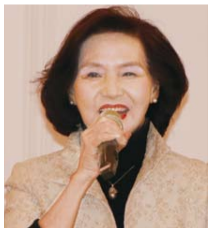
林姿妙縣長歡迎大家到宜蘭休閒觀光。