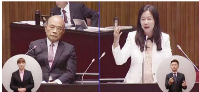
童惠珍委員質詢，圖左是蘇貞昌院長。

其實「僑務榮譽職人員」，是指在海外為中華民國推展外交，協助推動僑務有卓越表現者，且均為無給職。