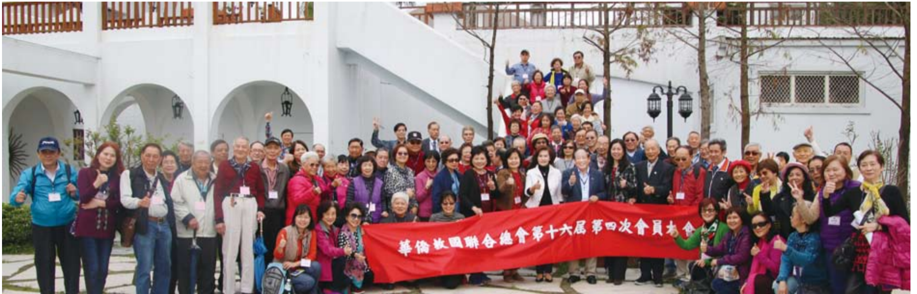
童惠珍委員、林姿妙縣長與全體會員留下難得合影。

僑光社／台北 華僑救國聯合總會第16屆第4次會員大會、一日遊活動，3月6日上午在宜蘭冬山河香格里拉飯店舉行，超過160位會員熱情參加，一整天太陽公公賞臉，會員們呼吸蘭陽平原潔淨的空氣，體驗大自然慢活與人文風情。僑選立委童惠珍及宜蘭縣大家長林姿妙縣長在百忙之中都熱情參與本會活動，常務理事葛維新在會議中率先支持鄭理事長明年競選連任，獲得全體會員熱烈掌聲響應，期盼鄭理事長再度帶領僑聯締造佳績。