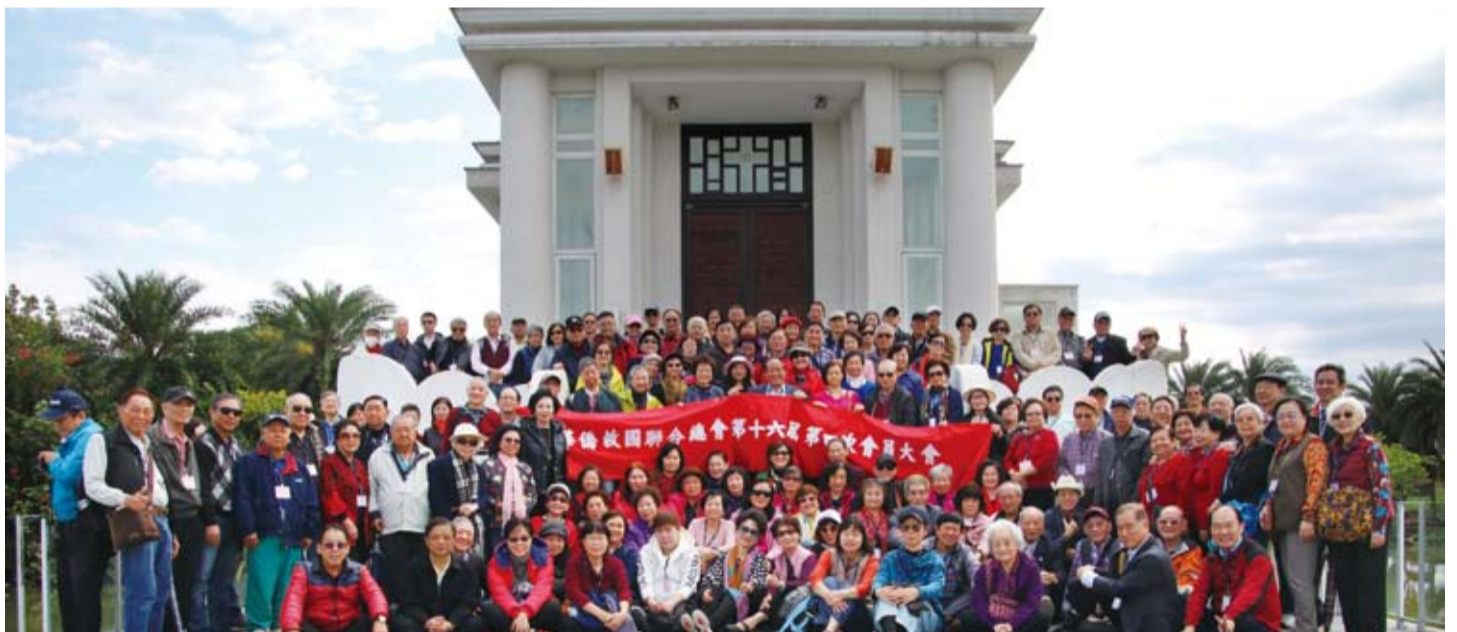
全體會員在山明水秀的宜蘭冬山河大合照。

僑光社／台北 華僑救國聯合總會第16屆第4次會員大會、一日遊活動，3月6日上午在宜蘭冬山河香格里拉飯店舉行，超過160位會員熱情參加，一整天太陽公公賞臉，會員們呼吸蘭陽平原潔淨的空氣，體驗大自然慢活與人文風情。僑選立委童惠珍及宜蘭縣大家長林姿妙縣長在百忙之中都熱情參與本會活動，常務理事葛維新在會議中率先支持鄭理事長明年競選連任，獲得全體會員熱烈掌聲響應，期盼鄭理事長再度帶領僑聯締造佳績。