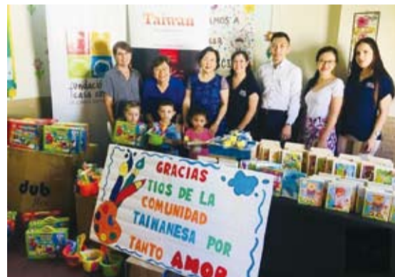
巴拉圭搖籃之家基金會感謝僑界捐贈教材教具。 (轉載自宏觀電子報)

巴拉圭「搖籃之家基金會」是慈善托育機構，目前照顧約400名年約2至5歲，來自低收入戶的孩童，提供衛生與膳食照顧，協助貧