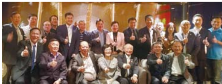
海外僑胞訪旅台各潮汕(州)同鄉會。

(簡稱總會)於民國105年起創立。依據章程確定會務宗旨，為旅居臺灣一佰多萬潮汕鄉親服務，關心旅居臺灣潮汕長者。協助第二代、第三代青少年構築交流平臺，順勢發展。並鼓勵潮汕籍在校學生、總會設有獎學金辦法。