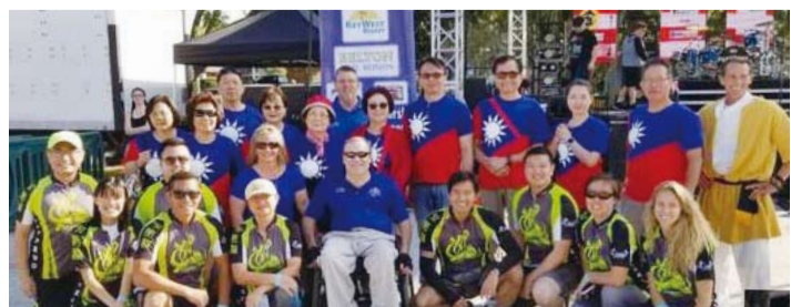
中佛州龍舟賽，臺灣代表隊獲銅牌。(轉載自宏觀電子報)

救蒼生，客家族群為了感念女媧娘娘的恩澤，特別在天穿日這天都會放下工作「共唱山歌歡慶」、「用板食祭祀」，也因此流傳了一句客家俗諺：「有做無做，聊到天穿過，有賺無賺，總愛聊天穿」，天穿日蘊含著讓大地休養生息的意涵，更彰顯客家人崇敬天地、尊重自然的精神，深具文化傳承意義。(轉載自宏觀電子報)