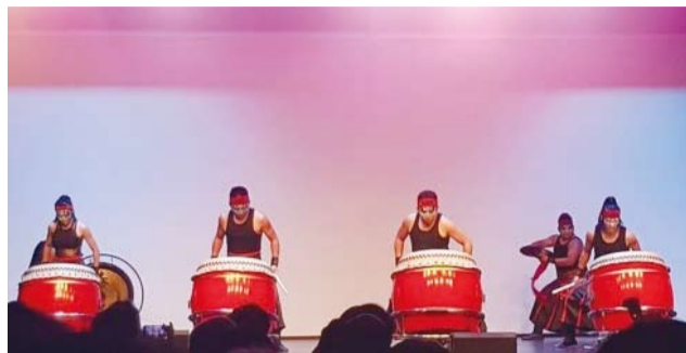
▲九天民俗技藝團精彩演出。(轉載自宏觀電子報) ◀中華青年友好訪問團。(轉載自宏觀電子報)

昆士蘭／布里斯本國際藝術節暨歡慶和諧週3月8日晚間在新利班演藝中心SunPAC隆重登場，從臺灣