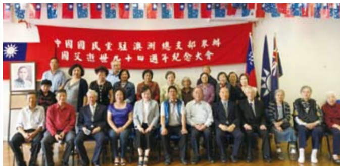
澳洲國父逝世94週年紀念大會與會者合影。