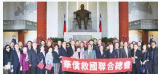
僑胞代表向國父致敬後合影。