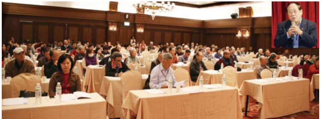
鄭理事長（右上角）在會員大會致詞，感謝大家支持僑聯。

店，全體會員先在矗立於湖中央的教堂前拍大合照，本會同仁已在前一天布置妥會場，挑高寬敞的會議室令會員讚嘆不已，與會會員感謝本會同仁的用心，隨即進行