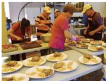
昆士蘭客家會理監事籌備客家餐點。(轉載自宏觀電子報)

傳統習俗上，農曆正月二十日是「天穿日」又稱天穿節或補天節，相傳上古時期，水神與火神相爭，將天空撞出破洞，女媧為免去人間苦難，於是煉石補天，解