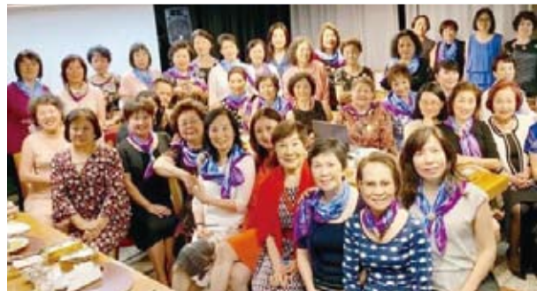
世界華人工商婦女企管協會巴西分會全體婦女大合照留念。(轉載自宏觀電子報)